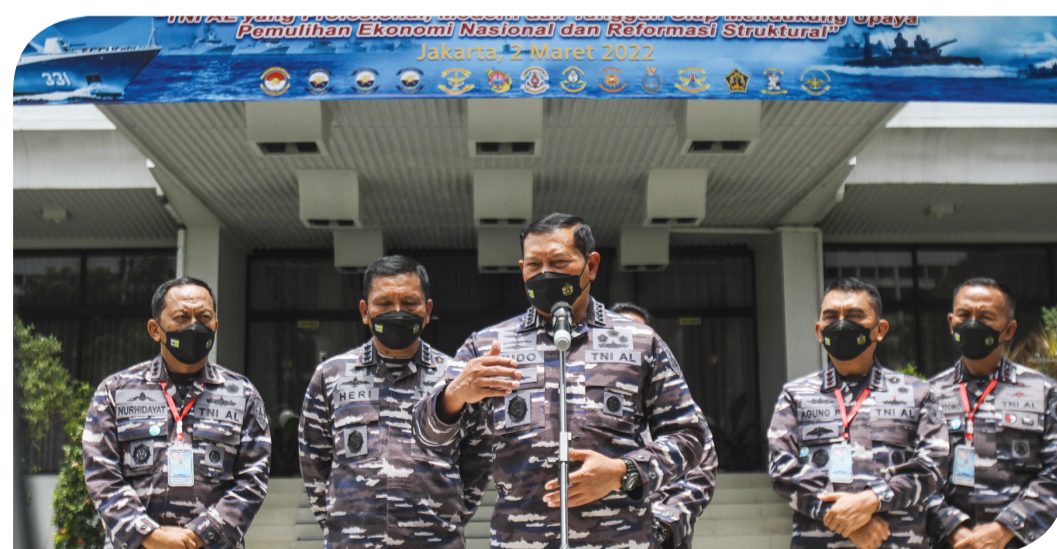
RAPAT TNI AL 2022

Selain itu, pemerintah juga mencatat bahwa kini terdapat 23.198 orang berstatus suspek. ● mar